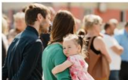
Slavnostní otevření nové sportovní haly, červen 2025