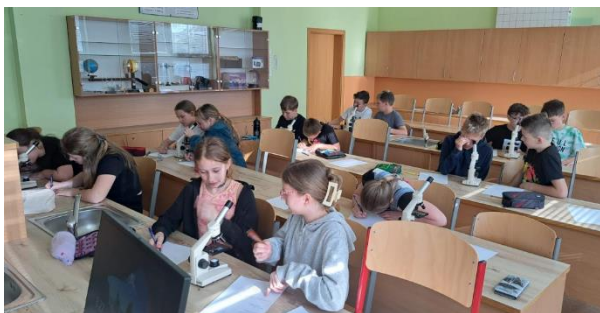
Mikrosvět v 5. B – pozorování plic, kůže, tlustého střeva – propojení p. uč. 1. a 2. stupně – spolupráce p. uč. Mazár, p. uč. Coufalová