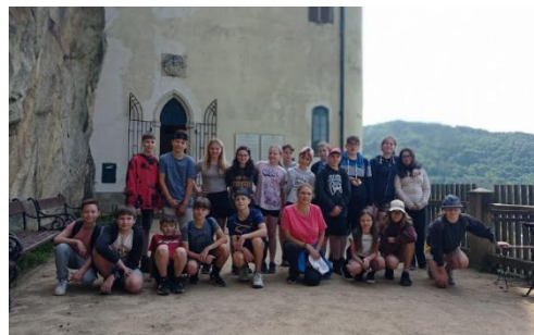
Škola v přírodě, 6.A